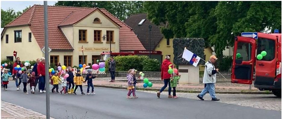
Kita-Umzug mit der Freiwilligen Feuerwehr Gingst